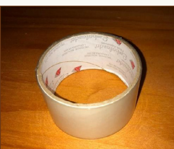
FITA ADESIVA OU CREPE