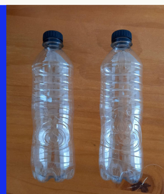
2 GARRAFAS PET PEQUENAS